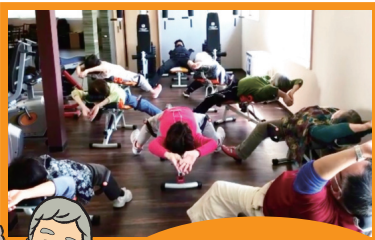
ワンダーコアを使った体験エクササイズ