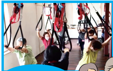
リップ60を使った下肢エクササイズ